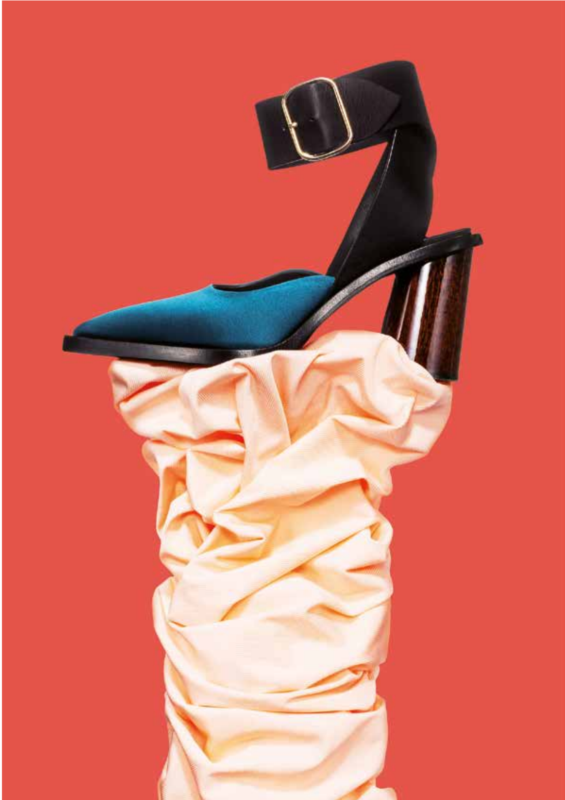
ANKLE STRAP IN TESSUTO E PELLE, PAUL SMITH TESSUTO BRIGHTON, 92% POLIAMMIDE 8% ELASTANE, JERSEY LOMELLINA