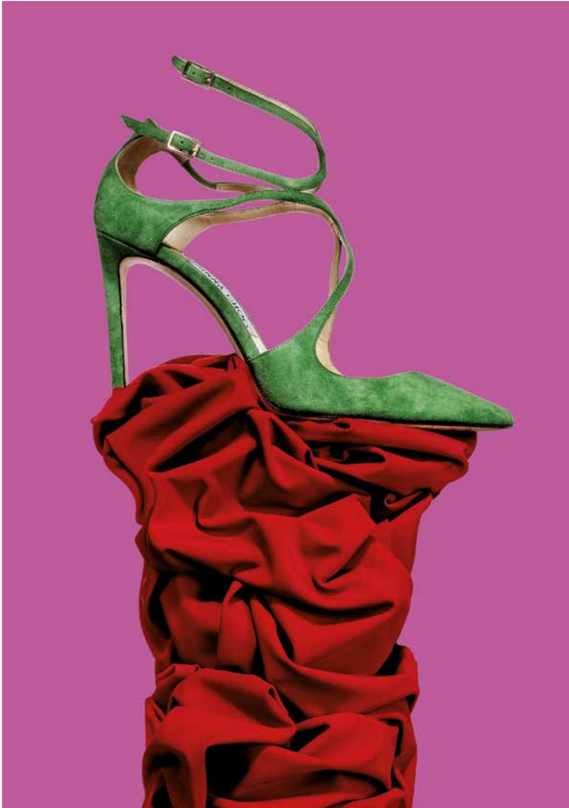
ANKLE STRAP IN SUEDE, JIMMY CHOO TESSUTO VITA, 78% POLIAMMIDE RICICLATA 22% ELASTANE, CARVICO