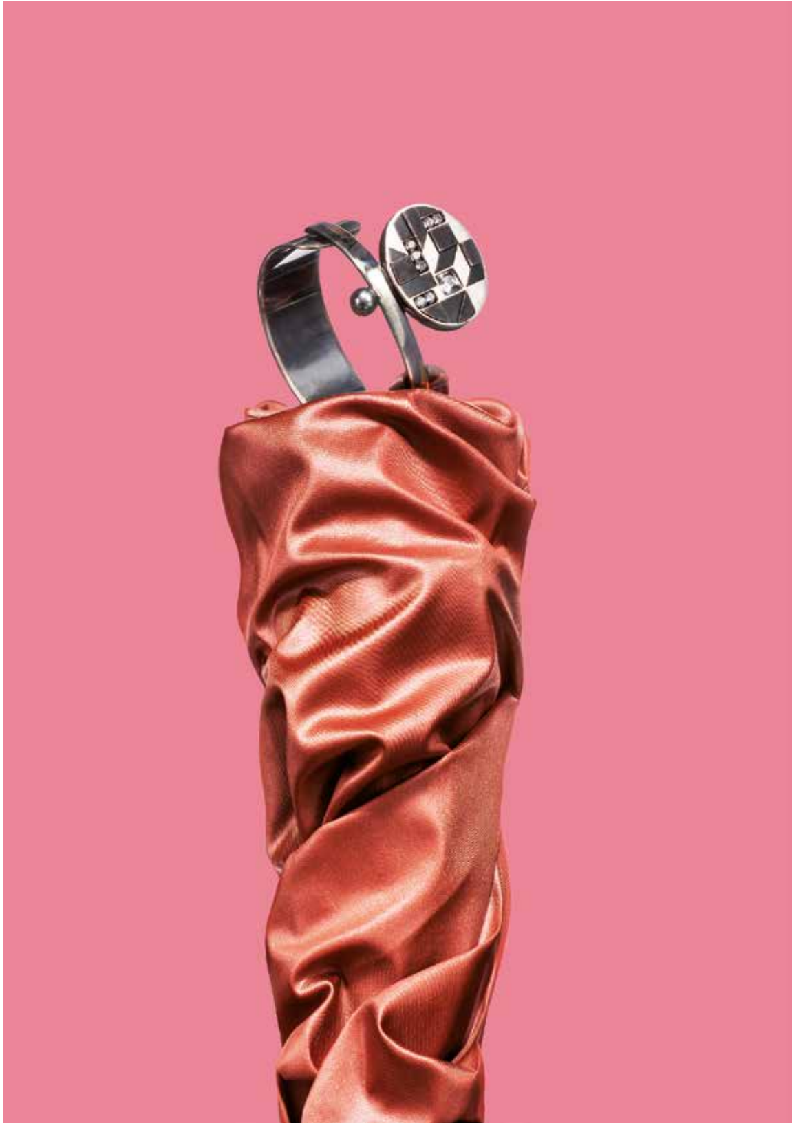
BRACCIALE IN ARGENTO SMALTATO CON ONICE E ZIRCONI, BOTTEGA VENETA TESSUTO BEVERLY, 79% POLIAMMIDE 21% ELASTANE, CARVICO