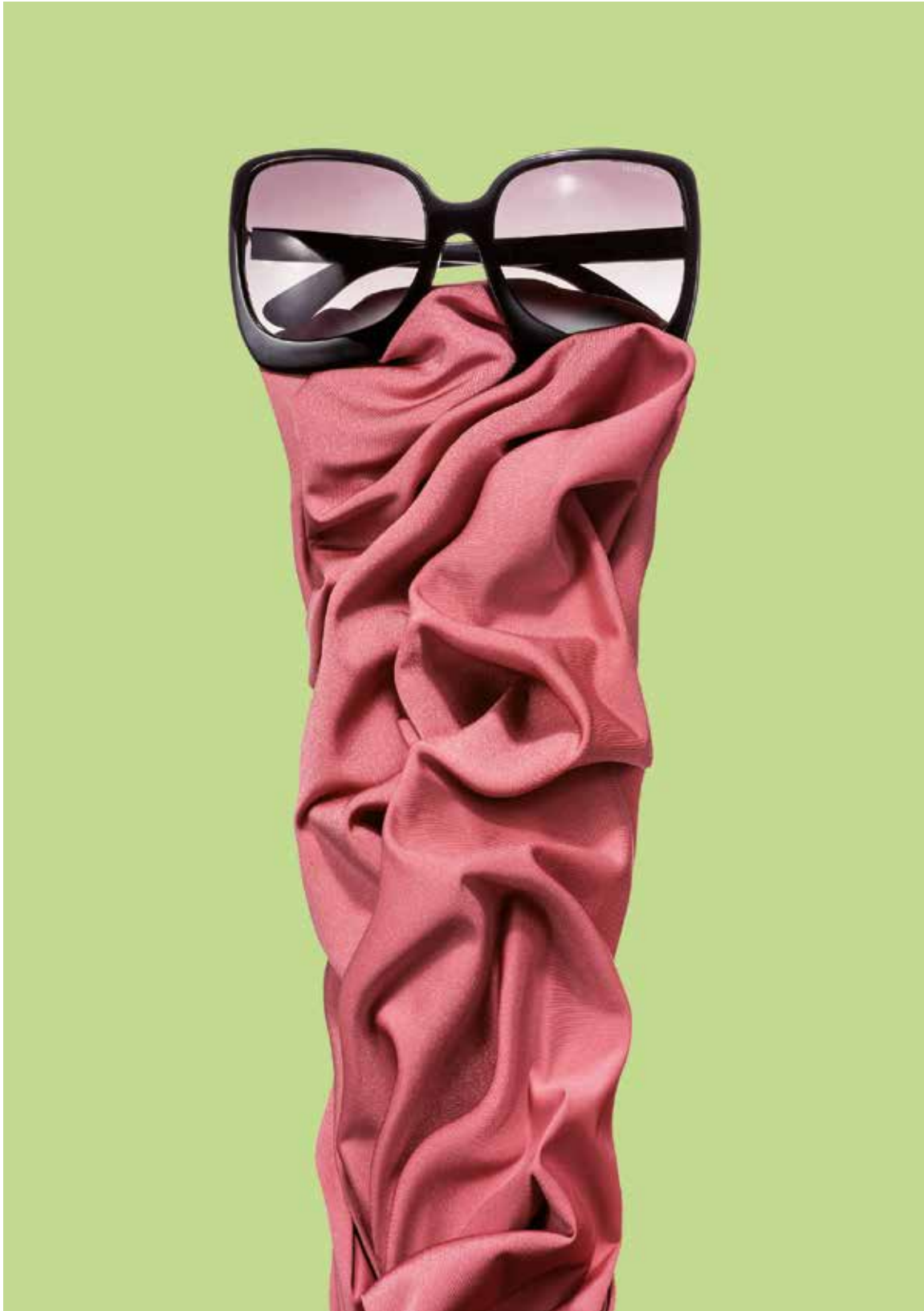
OCCHIALI DA SOLE IN ACETATO, TOM FORD TESSUTO SUMATRA, 80% POLIAMMIDE 20% ELASTANE, CARVICO