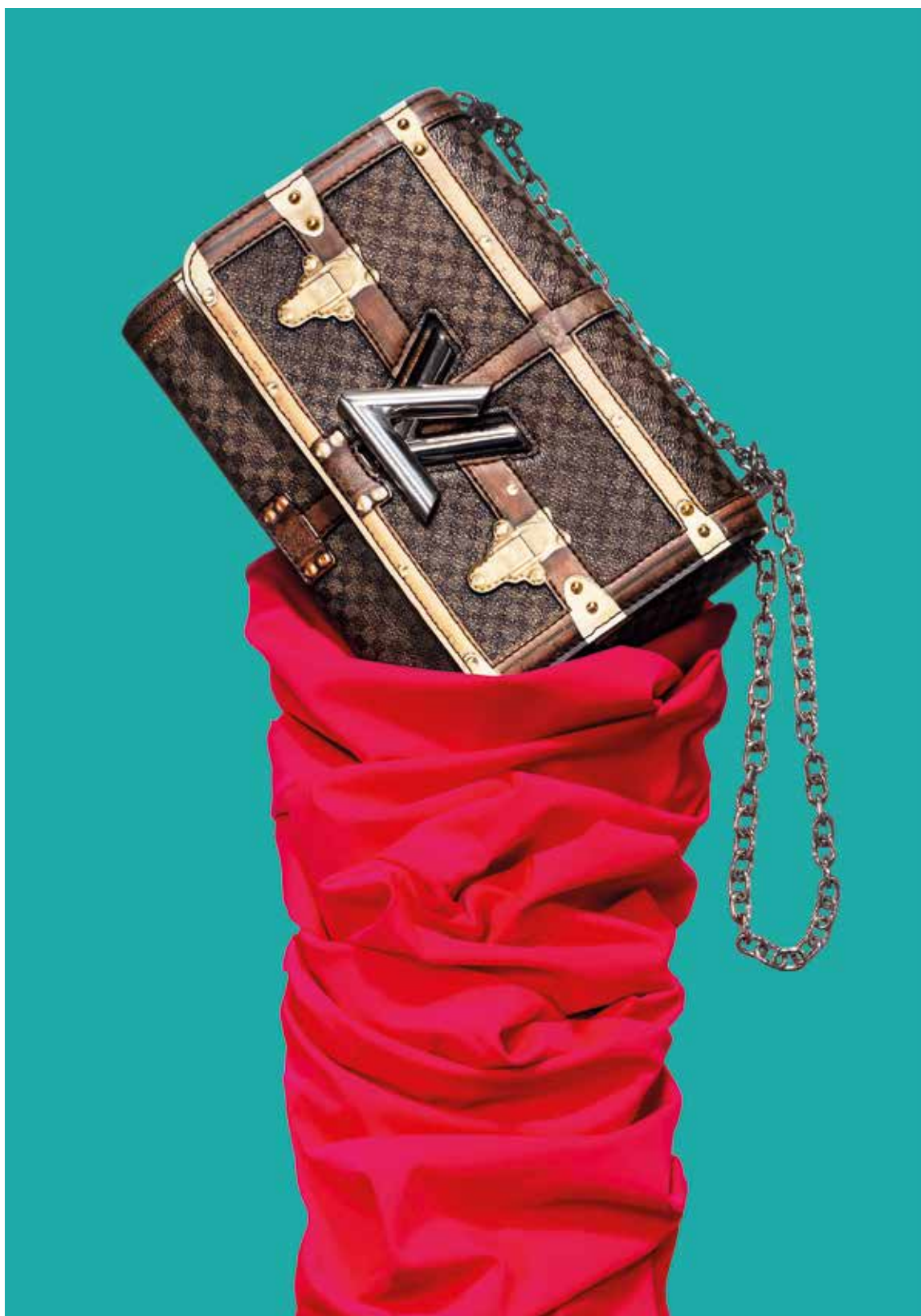
BORSA IN TELA RIVISITATA CON FINITURE IN PELLE, BORCHIE E DETTAGLI IN OTTONE DALLA FINITURA ARGENTATA, LOUIS VUITTON TESSUTO VITA, 78% POLIAMMIDE RICICLATA 22% ELASTANE, CARVICO