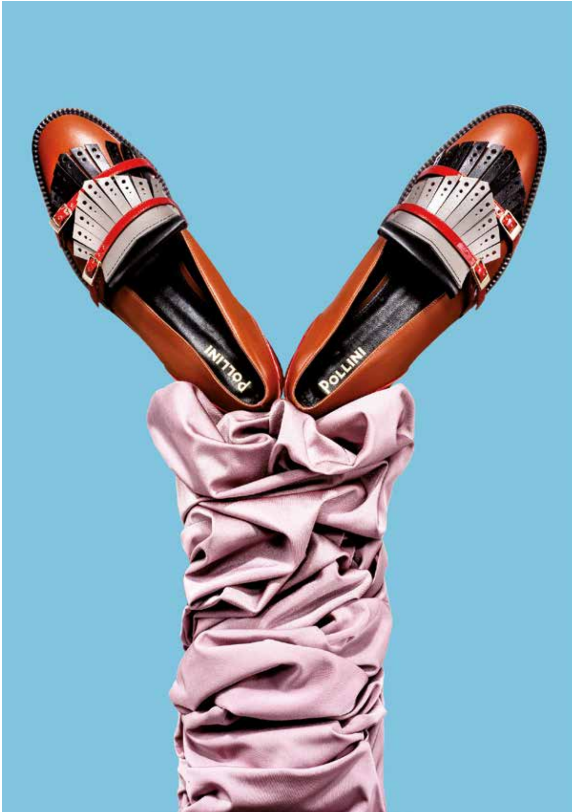
MONK STRAP IN VITELLO SPAZZOLATO E VERNICIATO, POLLINI TESSUTO SUMATRA, 80% POLIAMMIDE 20% ELASTANE, CARVICO