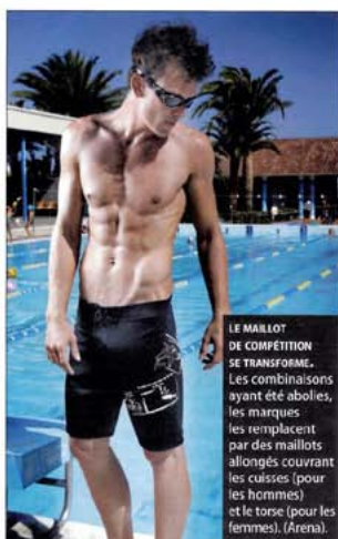
LE MAILLOT DE COMPÉTITION SE TRANSFORME. Les combinaisons ayant été abolies, les marques les remplacent par des maillots allongés couvrant les cuisses (pour les hommes) et le torse (pour les femmes). (Arena).

2012 pousse les marques à innover en matière de natation sportive sans pour autant dévoiler les modèles destinées à l'événement. Les nouvelles contraintes imposées par la Fédération internationale de natation - Fina - contraignent les marques à utiliser des matières textiles qui ne couvrent plus que les cuisses pour les hommes et également le torse pour les femmes. Speedo lance une ligne de maillots nageurs et de «jammers» (caleçon moulant s'arrêtant au-dessus du genou) aux panneaux assemblés par collage, afin d'améliorer l'hydrodynamisme. Aquasphere privilégie la compression musculaire au moyen d'une maille microfibre plus dense, rendue élastique par un Lyca Power aussi résistant au chlore que le Pbt employé dans la ligne destinée à l'entraînement régulier.