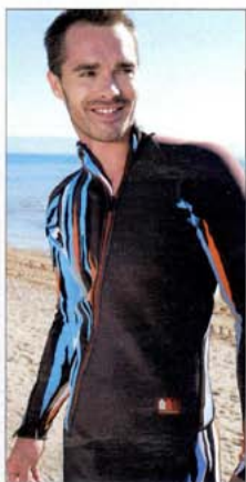
MAILLOT I-SWIM. En travaillant la maille contrecollée sur le néoprène, la marque apporte une note de fantaisie inédite aux tenues isothermes.