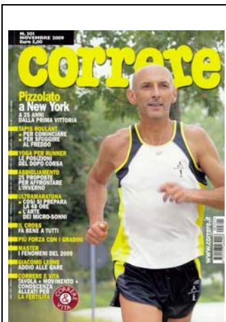
CORRERE N° 301