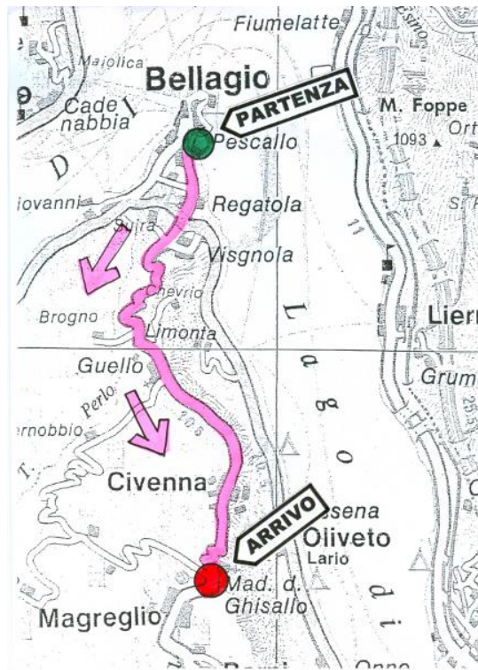
Passo del Ghisallo, da Bellagio